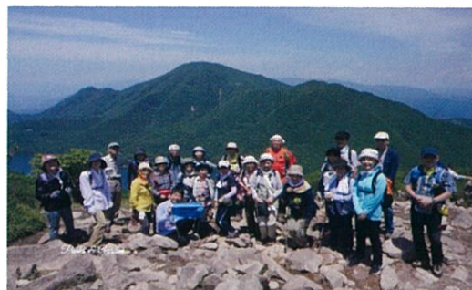
地蔵岳山頂から最高峰黒檜山を望む

8:45～ 受付(赤城公園ビジターセンター集合) 9:00～ 9:10 開講式 9:10～ 13:30 赤城公園ビジターセンター＝句碑の道＝見晴登山口＝地蔵岳＝小沼(左周り)＝鳥居峠＝覚満淵＝赤城公園ビジターセンター 講義 13:30～ 15:00