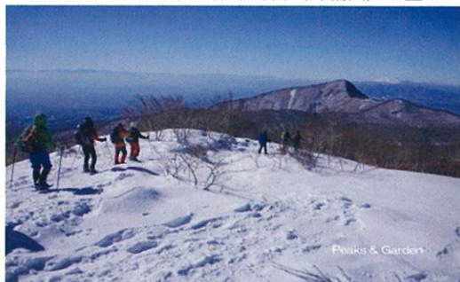
長七郎山稜線を行く(正面は荒山・浅間山)

8:45～ 受付(赤城公園ビジターセンター集合) 9:30～ 13:00 車で小沼駐車場へ(時計まわりで)＝長七郎山＝小沼水門＝小沼横断＝小沼駐車場 車でビジターセンターに移動 講義 13:30～ 15:00