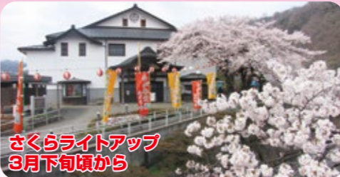
さくらライトアップ 3月下旬頃から